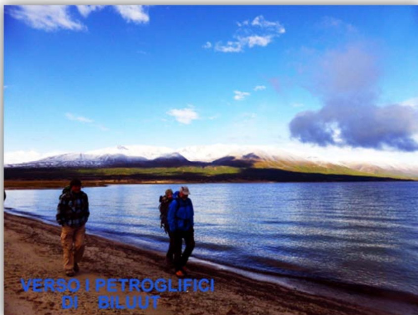
VERSO I PETROGLIFICI DI BILUUT