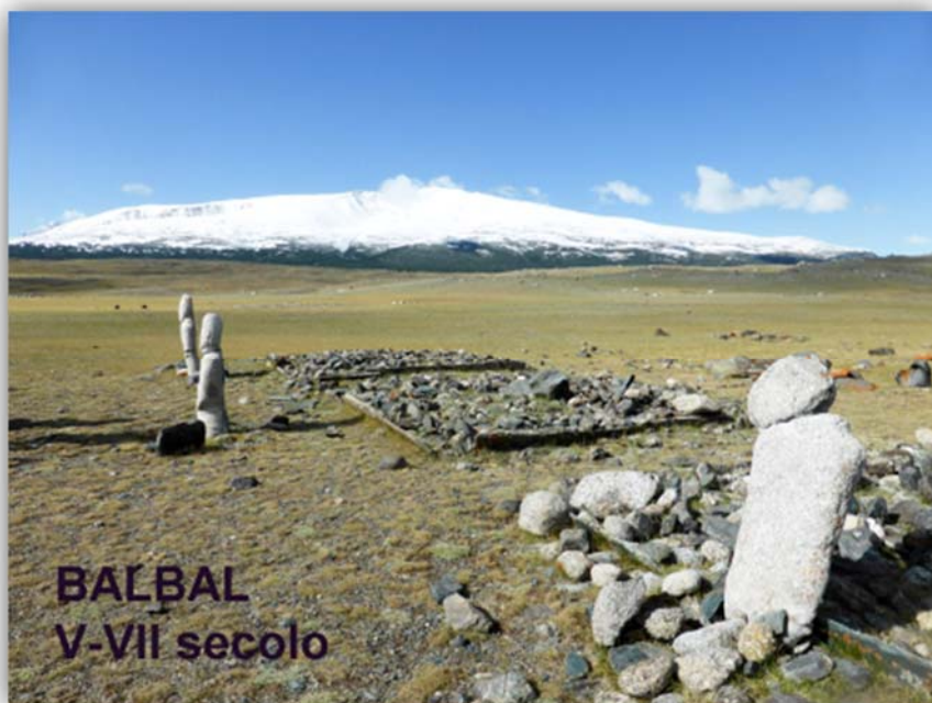
BALBAL V-VII secolo