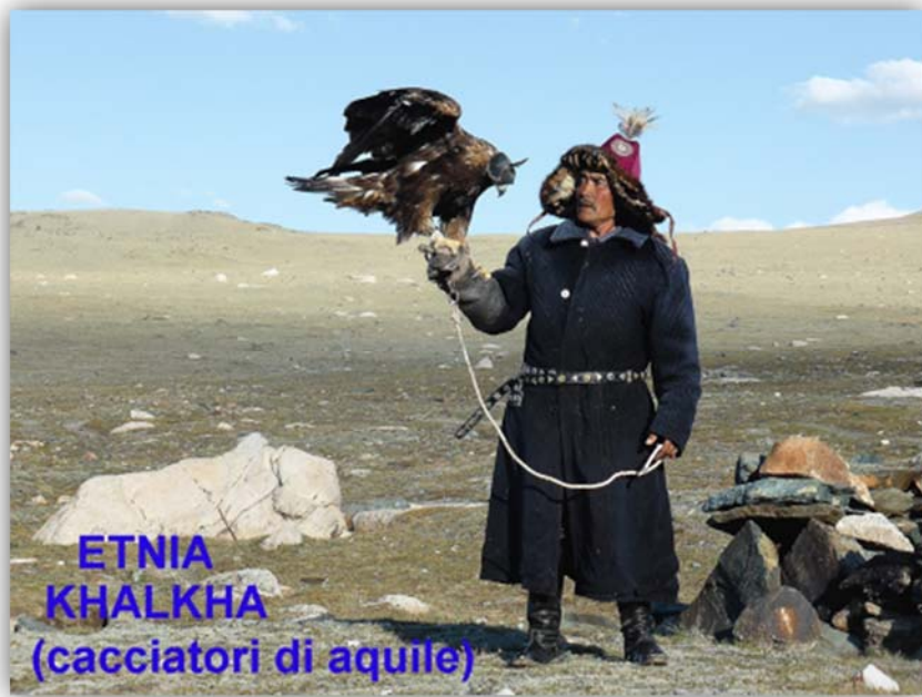
ETNIA KHALKHA (cacciatori di aquile)